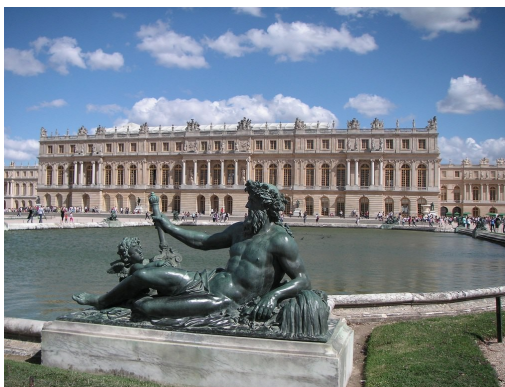
Palacio de Versailles

Un ejemplo de ello, fue el Palacio de Versailles, de estilo suntuoso y elegante. Es un edificio que cumplió las funciones de residencia real, de la corte y de sede